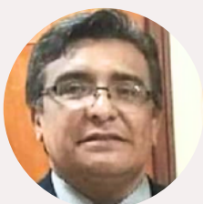
Dr. Ireneo Barreto (Paraguay)

¡Docentes nacionales e internacionales de primer nivel!