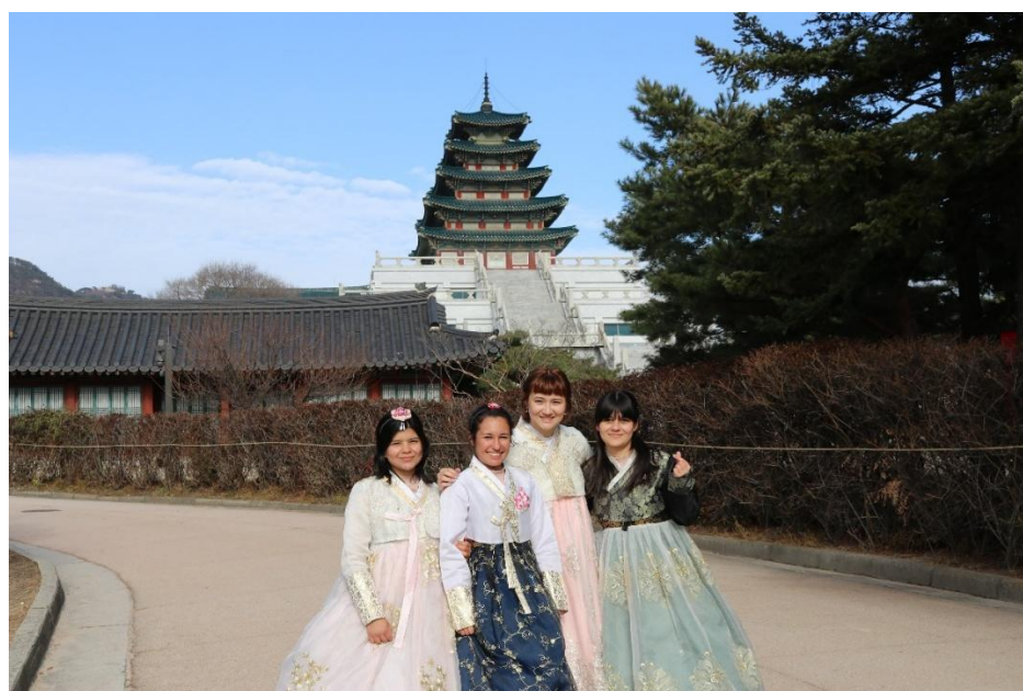
Palacio de Dinastía Josun con la ropa tradicional Hanbok de Corea