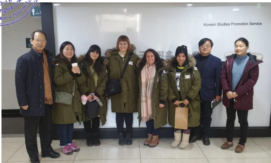
Con los profesores de la Departamento de Promoción de Estudios Coreanos de Instituto de Investigación de Estudios Avanzados de Corea

Misión: Formar profesionales de la educación altamente calificados, acorde con las necesidades socioculturales y las exigencias éticas; realizar investigaciones y ejecutar programas de extensión, implementando las políticas nacionales, en concordancia con las regionales y mundiales.