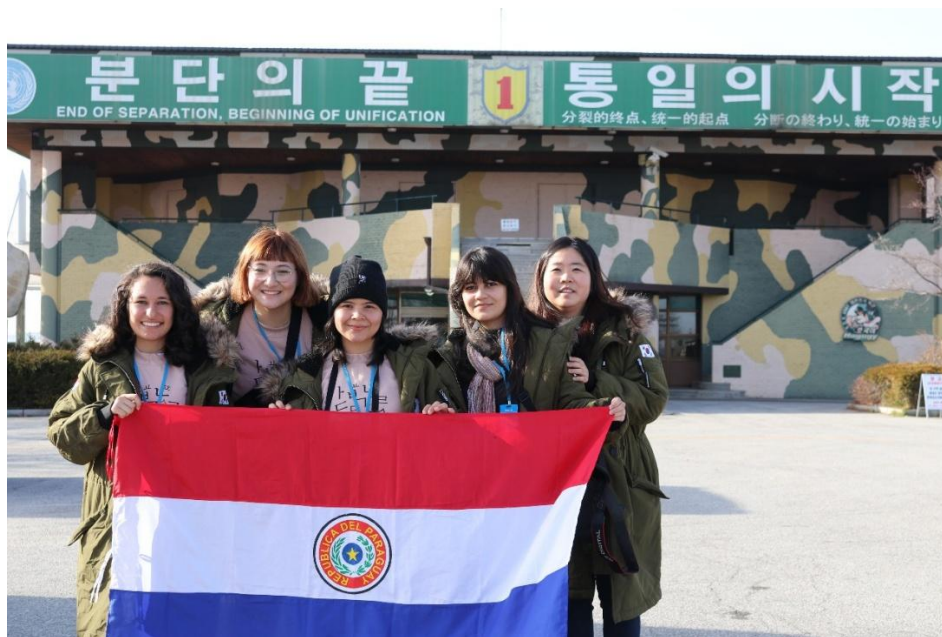
Museo de frontera entre Corea del Sur y Norte