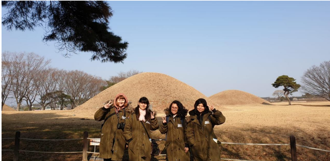
La Tumba de los Reyes, ubicada en el Parque Nacional del Patrimonio