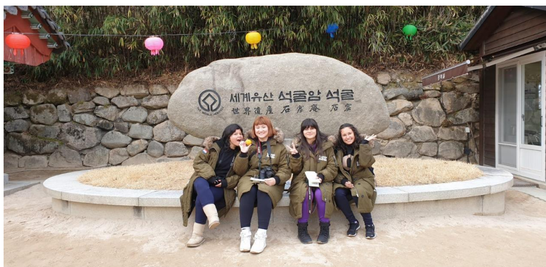
Visita a la cueva natural Seokgul de Tesoro Nacional por Unesco