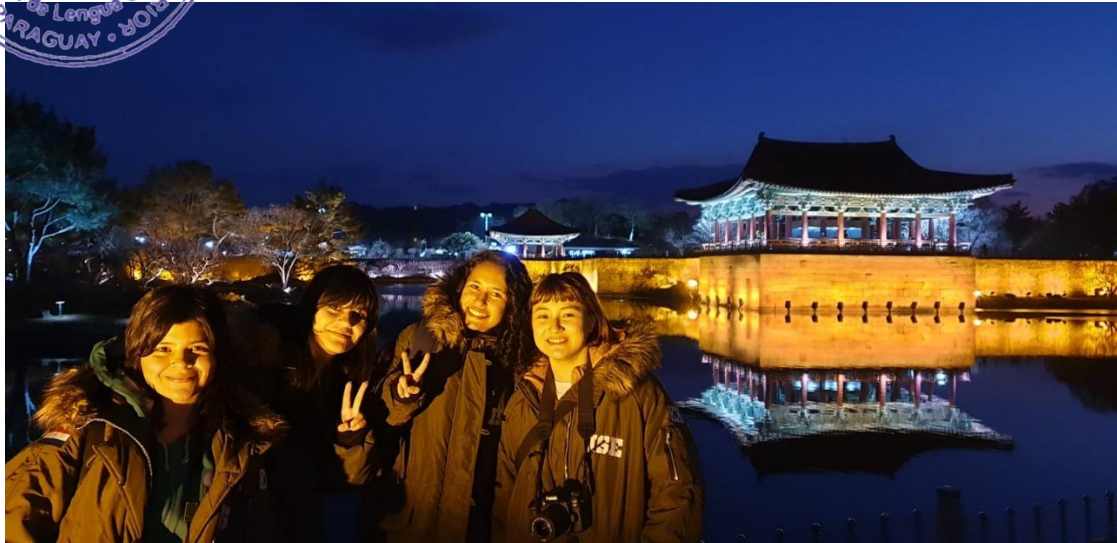
Palacio de de Rey Lee Sung Gye

Misión: Formar profesionales de la educación altamente calificados, acorde con las necesidades socioculturales y las exigencias éticas; realizar investigaciones y ejecutar programas de extensión, implementando las políticas nacionales, en concordancia con las regionales y mundiales.