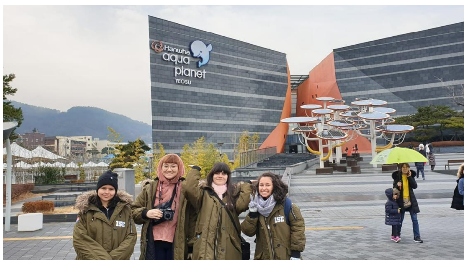
Visita a parque acuático